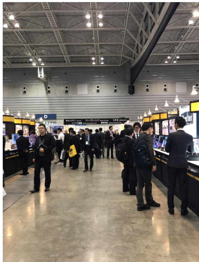
■ 国際画像機器展2017&ビジュアルメディア Expo2017の来場者数は3日間で16,194人