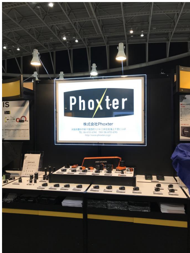
■ 国内初上陸のHIKVISIONカメラを展示